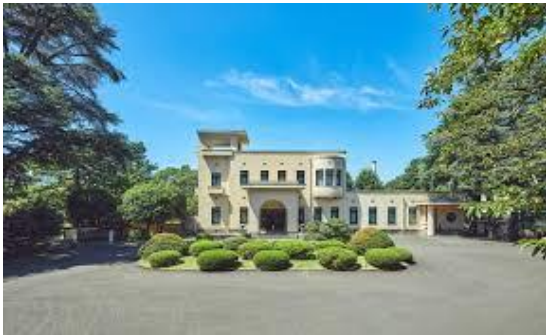
東京都庭園美術館